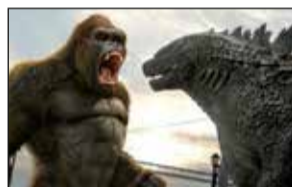
GALAXY Godzilla Vs. Kong