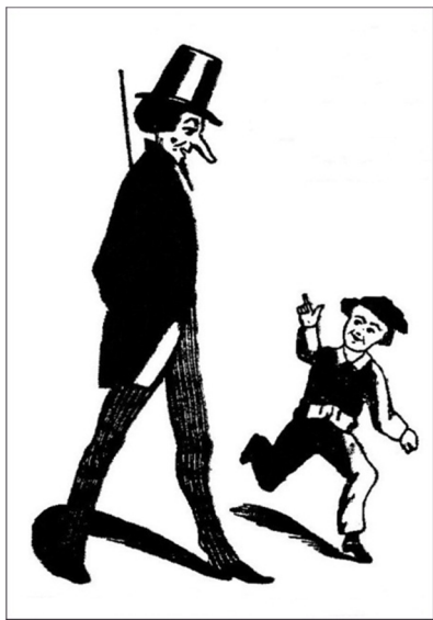
Ilustração que acompanhava o texto no Novo almanach de lembranças

O meu amigo Boaventura Jeremias Pascoal, é um desses entes infelizes a quem a natureza parece haver formado a capricho, tornando-os renegados das belezas primitivas da mãe Eva.