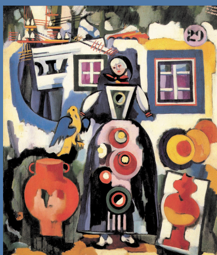
Amadeo de Sousa Cardoso, Canção popular com pássaro do Brasil . Col. Museu Municipal Amadeo de Sousa Cardoso – Amarante