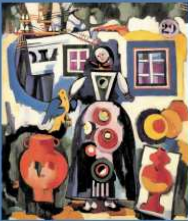
Arcações de Soares Cardoso, Conção popular com póssero do Brasil. Cd. Museu Municipal Amadeo de Soares Cardoso - Angra do Heroísmo