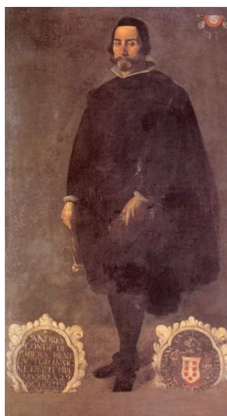
Anónimo Caballero de Santiago, XVII