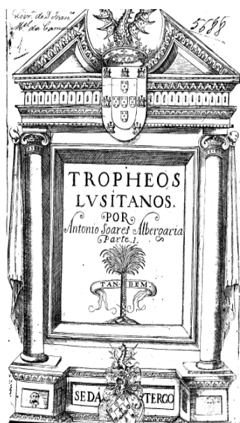
Tropheos Lvsitanos. António Soares de Albergaria, Lisboa, 1631 Colección particular

Não devemos esquecer que as glórias da nobreza, em termos políticos, mas também visuais, criam uma construção discursiva que vincula o nobiliárquico com o projecto da coroa, pelo qual a honra dos cavaleiros é também a honra da república, uma vez que todos eles são “servidores” e “militantes” do esforço dos distintos soberanos, pois geralmente, os hábitos eram concedidos por serviços à coroa. Com isso se projecta, que as armarias e as suas luzes são também as do reino, pelo que a vinculação entre todos os honrados deve ser semelhante. Um universo analógico-figurativo sobre os sinais da honra que deve ser inserido dentro da realidade sistémica representada pela nobreza e as necessidades absolutas de legitimação da sua posição.