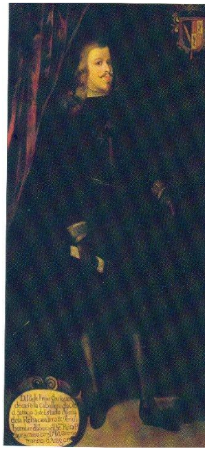
Caballero Santiaguista, s. XVII Colección particular