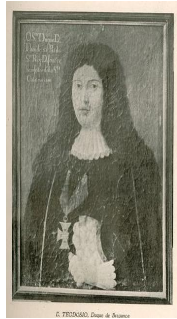
Retrato do Duque de Bragança.

Tradicionalmente tem-se procurado ver na representação de titulares e não titulares durante os séculos XVII y XVIII, uma clara diferença. Analisou-se a representação da nobreza e de outros atributos morais. Este facto deriva, em primeiro lugar, da imposição que a hierarquização social apresenta no momento de interpretar o visual, mas há que ter em conta que o que na maioria dos casos se procura oferecer é a presença de um mundo “heróico” ao modo clássico, de uma determinada ideia de fama, de “voz pública” sobre aquilo que a honra representa. Um símbolo da fama e uma desconstrução de uma determinada ideia de prestígio. Não há, por isso, desvalorização nos próprios atributos de um cavaleiro de Cristo ou de Santiago face a um Duque. Antes pelo contrário, o próprio valor de possuir um hábito de uma Ordem Militar, deriva de uma leitura vertical do prestígio social. As Ordens, sob o mestrado dos monarcas luso-castelhanos não eram, de forma alguma, instituições desprestigiadas, mesmo que em certas ocasiões alguns dos pretendentes a um hábito pudessem ser de nobreza duvidosa, mas, pelo contrário, a posse de uma cruz era um argumento suficiente para se fazer retratar no momento da concessão, assim como para a colocar nesse corolário do passado que era o brasão.