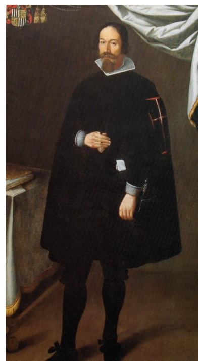
Retrato de un Fidalgo de la familia Cogominho. Museu de Évora