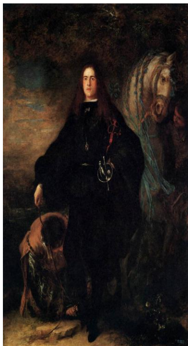
Juan Carreño, Duque de Pastrana. 1640, 1600. Museo del Prado de Madrid