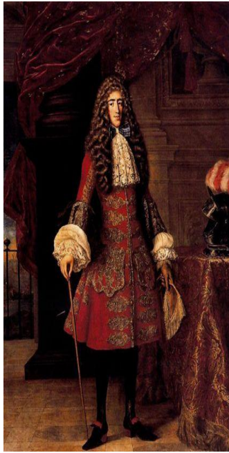
Retrato del IX duque de Medinaceli, 1711 Colección particular