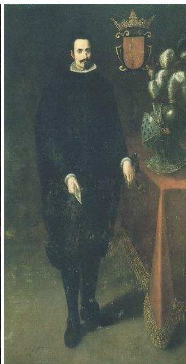
Anónimo, Retrato de caballero de Santiago, 1633. Coleção particular