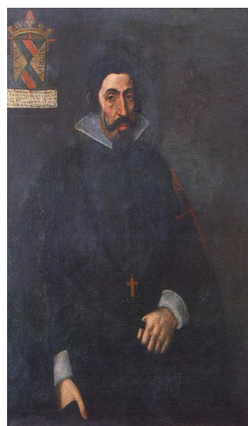
Retrato de Lopo Furtado de Mendonça Museo de Arte Antiga

Longe de pensar numa marginalidade de algumas das categorias nobiliárquicas no momento da sua representação, as práticas visuais da nobreza durante os séculos XVII e XVIII procuraram formas de leitura monolíticas do seu ethos político, fórmulas que longe de serem interpretadas em separado devem ser compreendidas e inseridas dentro da cultura nobiliárquica. Por isso, todos os cavaleiros de hábito, independentemente da sua origem, eram representados com apelo aos mesmos critérios, à “indústria” das suas qualidades. O mesmo se passa com os beneficiados com um bra-