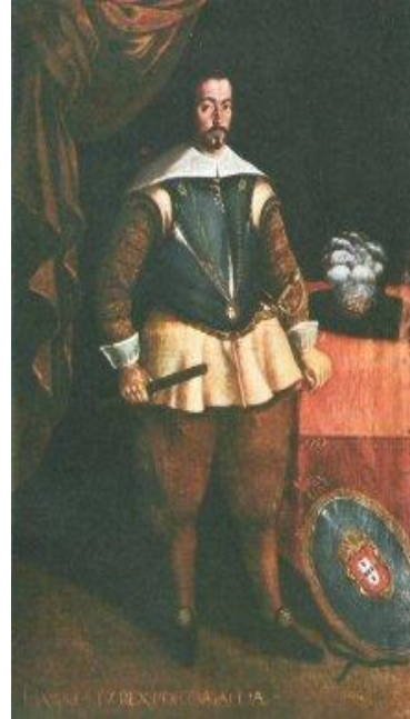
Retrato de D. João IV, 1643. Palácio de Vila Viçosa

Do mesmo modo, aqueles que não estavam entre os primeiros escalões da hierarquia de poder, encontravam nesta tipologia do retrato e na exposição dos seus sinais uma forma de identificação com a cúpula do sistema de honra, convertendo o visual da pintura num meio para se instruir, bem no meio cortesão 24 ou em outros espaços de sociabilidade dentro do cursus honorum nobiliárquico. Comparemos as imagens de um anónimo cavaleiro de Santiago da segunda metade de seiscentos com a dos grandes titulares luso-castelhanos, como o são os duques de Medinaceli ou de Bragança.