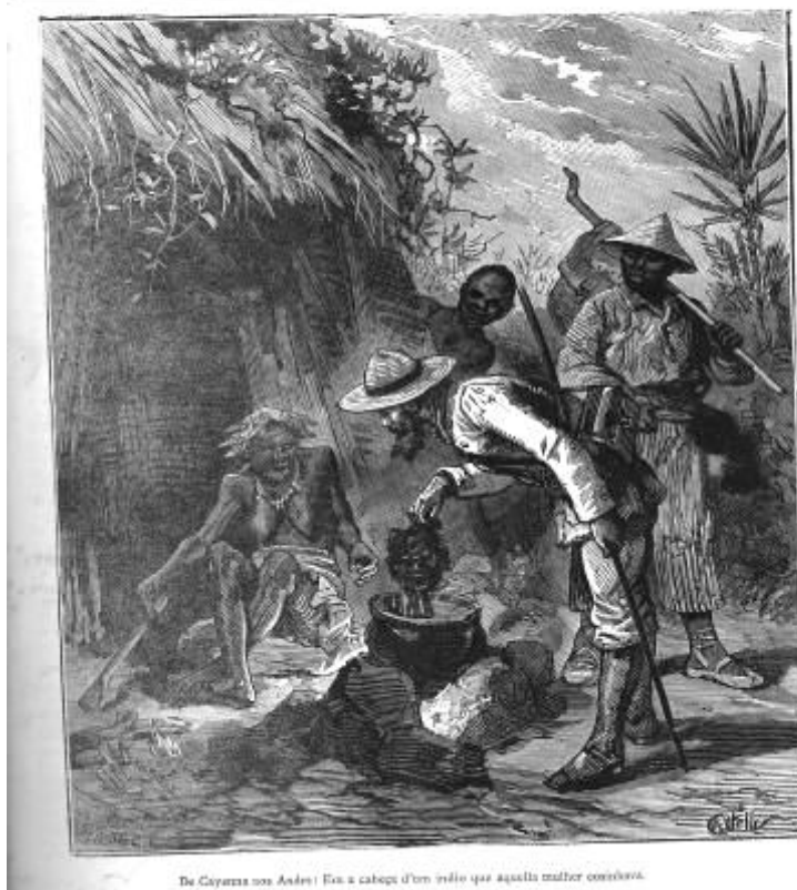
Fig. 1 – O Jornal de Viagens: Ilustração Geográfica , Porto, 3º ano, nº 108, Domingo, 19 de Junho, 1881, p.1.

As descrições dessas expedições, por vezes dramáticas, cheias de perigos, feitas em nome da ciência e da civilização, resultavam de percepções ao mesmo tempo negativas e positivas desses espaços.