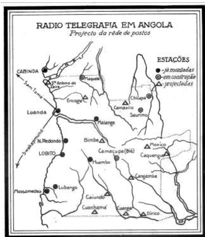
Fig. 3 – “Mapa da rede telegráfica em Angola”. – Escala indeterminada. - in: Angola: Revista Mensal Ilustrada , Propriedade da Empresa de Publicidade “Angola”, Limitada, 1º ano, Luanda, Janeiro, 1923, p.22

Assim, são difundidas representações de várias temáticas que testemunhavam as acções no domínio da “civilização” dos territórios. Textos e imagens que provavam a capacidade empreendedora de Portugal como país colonial, sendo por isso constantes as figurações de pormenores relativos à acção portuguesa surgindo, logo no início da década de 1920, várias publicações, que demonstravam aspectos dos planos de fomento realizados pela administração pública, como a rede telegráfica, na rede de ferroviária e a rede viária.