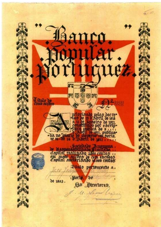
Acção do Banco Popular Português. Também disponível no Museu do Papel-Moeda da Fundação Cupertino de Miranda.

No seu logótipo constava o escudo de armas nacional colocado sobre a Cruz de Cristo, tendo em redor a expressão “BANCO POPULAR PORTUGUEZ”. Era uma sociedade anónima de responsabilidade limitada com um capital inicial de 500 contos (elevável a 1200 contos) dividido em 20 mil acções de 25 escudos cada. Estava sediado no Porto, na Rua do Loureiro, n.ºs 46 a 50, à direita da Estação de São Bento, na freguesia da Sé. Nas páginas d’ O Tripeiro 6 , é referido que em 11 de Junho de 1918 o banco se mudou para o prédio da Praça da Liberdade onde se encontrava o Café Suíço (na esquina da actual Rua de Sampaio Bruno com a Praça de D. Pedro). Contudo, só em 1923 se iniciaram negociações tendo em vista a instalação definitiva do banco naquela morada. É provável que o Popular Português tenha ali criado um escritório, mas é de todo impossível que tenha abandonado a sede na Rua do Loureiro, já que em 1928 ainda lá se encontrava.